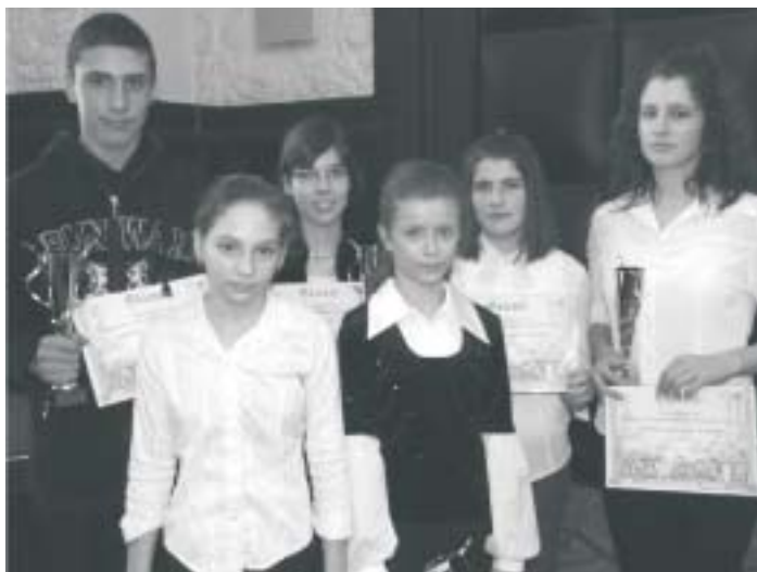
Hat ladányi diáksportoló vehette át Debrecenben a jutalmát.